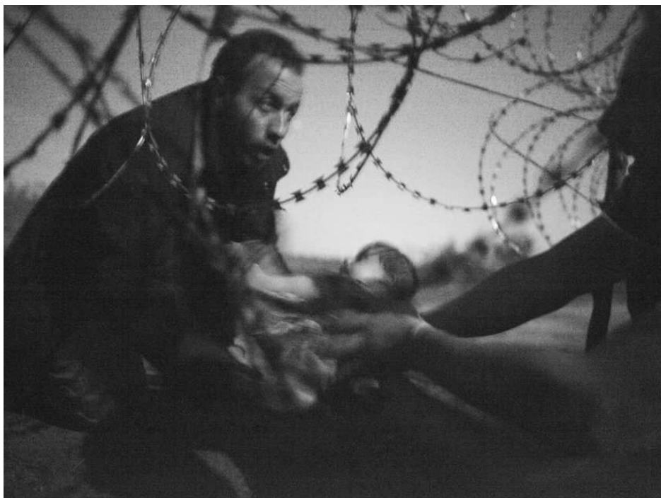
Esperança per a una nova vida. Fotògraf: Warren Richardson, 2014